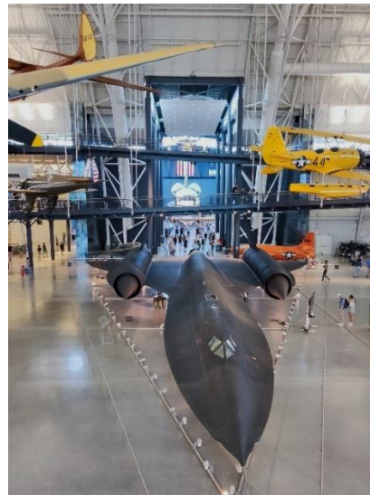
Abbildung 35: Blackbird und weitere Flugzeuge im selben Museum