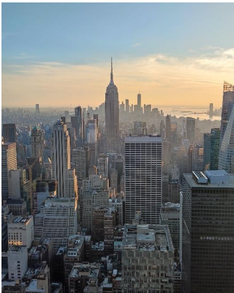
Abbildung 50: Blick vom Top of the Rock