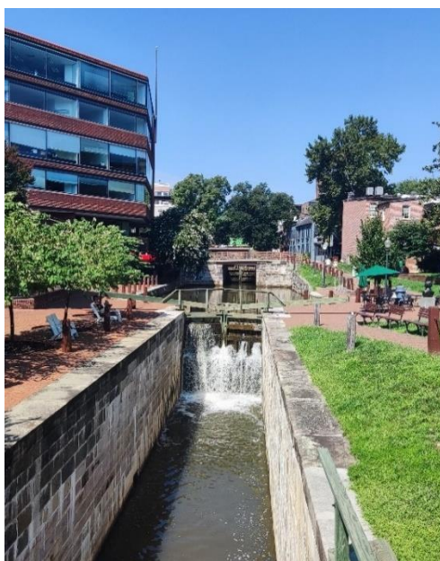
Abbildung 32: Fluss in der Nähe von Georgetown