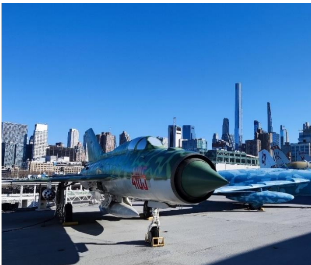
Abbildung 52: Auf dem Flugzeugträger (Intrepid Mesuem)