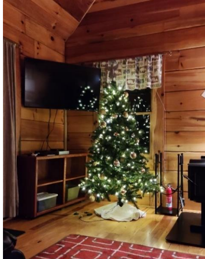
Abbildung 42: Tannenbaum im Cabin in the woods