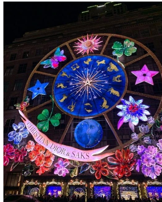
Abbildung 48: Dior's Carousel of Dreams in der 5th Avenue