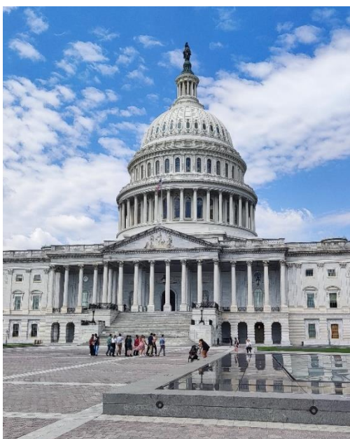
Abbildung 31: Das Kapitol

Eine Kommilitonin, mit der ich das Semester an der VT verbrachte, und ich, entschieden uns bei der Buchung der Flüge dazu, vor Beginn des Semesters sechs Tage in Washington D.C. zu verbringen. Die Stadt fand ich im Allgemeinen sehr schön. Was mir besonders auffiel: D.C. ist sehr sauber und gepflegt. In unserer Zeit dort besuchten wir die bekannten Sehenswürdigkeiten wie zum Beispiel das Kapitol, das weiße Haus, das Washington Monument und Georgetown. Diesen Stadtteil fand ich besonders schön, da dieser sehr an eine europäische Stadt mit eher engen Straßen, Klinkergebäuden und einer Shoppingstraße erinnert. Für mich ist Georgetown eine echte Empfehlung für jeden, der D.C. besucht! Sehr schön war ebenfalls ein Spaziergang über die Theodore Roosevelt Island, hier geht man über einen Holzsteg mitten durch die Natur. Darüber hinaus waren wir an beiden Standorten des Smithsonian National Air and Space Museums. Besonders das Museum am Flughafen ist ein klares Muss für alle, die sich für Luftfahrt interessieren. Insgesamt fand ich Washington sehr schön und im Vergleich zu New York City viel entspannter durch weniger Menschen und mehr Natur mitten in der Stadt.