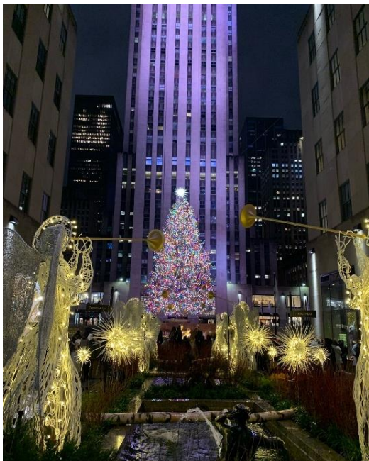
Abbildung 47: Rockefeller Christmas Tree

Als Abschluss des Semesters fuhren wir mit unserer Gruppe mit dem Zug für eine Woche nach New York. Jeder, der schon einmal in New York war, weiß, dass man diese Stadt nur schwer mit Worten beschreiben kann. Für mich war es bereits das zweite Mal dort, trotzdem war ich erneut beeindruckt und überwältigt von dieser Stadt, die wirklich nie schläft, mit ihren vielen Wolkenkratzern und Menschen. Geschlafen haben wir in einem Airbnb in New Jersey. Die Woche dort war für mich der perfekte Abschluss: Wir haben viele Sehenswürdigkeiten angeschaut, als persönliches Highlight einen Abend in einer Jazz Bar verbracht und viele der anderen Internationals getroffen, die ihr Semester ebenfalls so haben enden lassen. Abschließend flogen wir von New York aus zurück nach Hamburg.