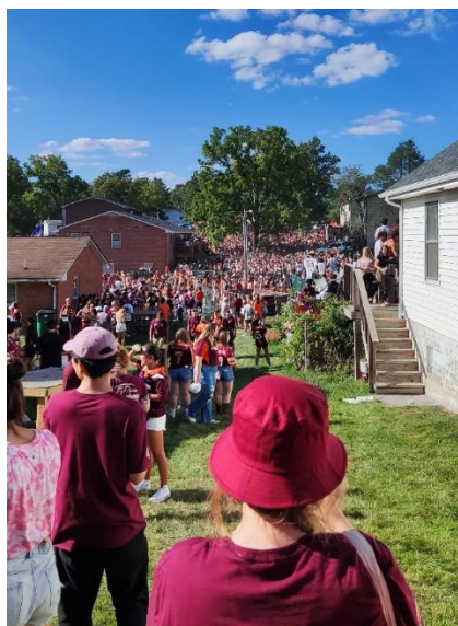
Abbildung 23: Tailgating in der Center Street