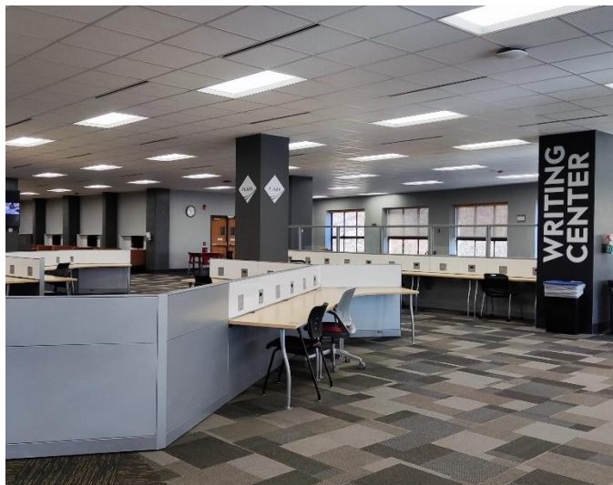
Abbildung 17: 2. Stock der Newman Library