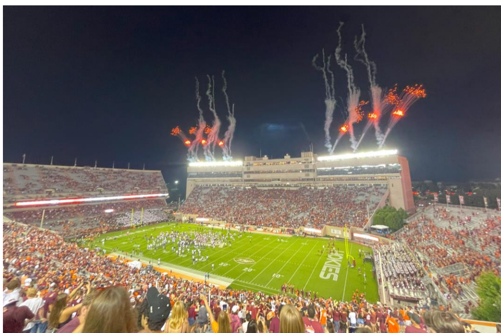
Abbildung 22: Eröffnungsshow eines Football Games im Lane Stadium

Oft waren wir bei Basketball-, Volleyball und Soccer Spielen der 1. Mannschaft zum Zugucken. Die Stimmung bei diesen Spielen war immer unfassbar gut, jedoch war dies kein Vergleich zu den Football Spielen. Dass Football in den USA groß ist, war mir bewusst, allerdings nicht in diesem Ausmaß: Die Stimmung an Gamedays war unbeschreiblich, alle waren in Feierlaune, und viele haben schon morgens mit dem Tailgating angefangen. Eine korrekte Übersetzung hierfür wäre wohl das Vorbereiten auf das Spiel, viel passender ist jedoch einfach Feiern und Trinken. Die wohl beliebteste Location hierfür war die Center Street, wo sich die Häuser der Studentenverbindungen (Fraternities und Sororities) befinden. Für die Spiele selber haben wir keine Karten gekauft sondern stets an der Student Lottery teilgenommen, bei der man mit etwas Glück Eintrittskarten gewinnt. Die Stimmung im Stadion kann man mit Worten nicht beschreiben. Ich wünsche jedem, selbst erleben zu können, wie 66.000 Menschen „Let's go Hokies“ schreien und zur Einlaufhymne „Enter Sandman“ springen und feiern. Den Moment, in dem ich dies zum ersten Mal erleben durfte, werde ich wohl nie vergessen. Ziemlich schnell festgestellt habe ich jedoch, dass es beim College Football weniger ums Spiel selber geht (welches ich zugegebenermaßen nach meist mehr als zwei Stunden nicht mehr so spannend fand), sondern viel mehr um die Stimmung und das Feiern drum herum.