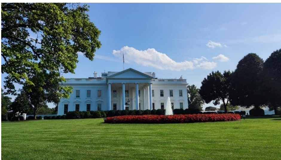
Abbildung 33: Das weiße Haus