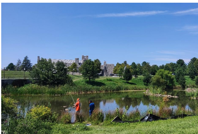
Abbildung 14: Duck Pond