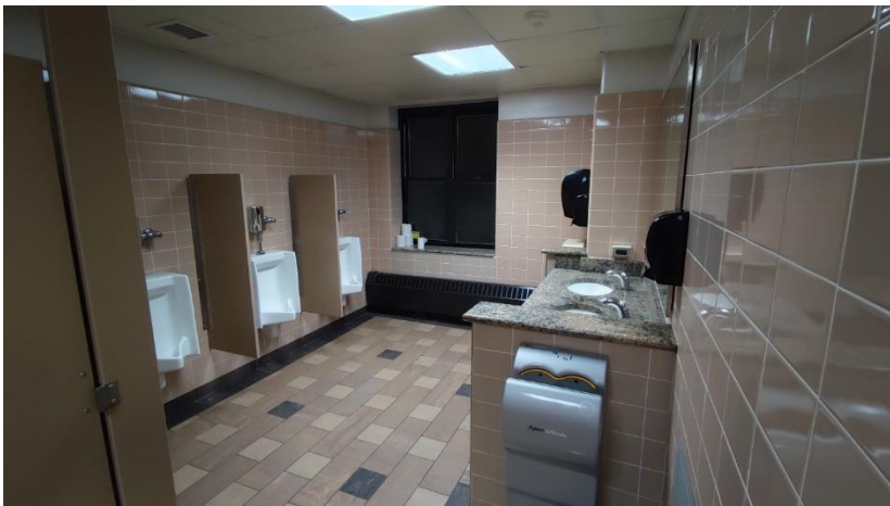
Abbildung 20: Waschraum

Geteilt habe ich mir mein Zimmer mit einem Mitbewohner, welcher leider überhaupt nicht geredet und auch kein Interesse an jeglicher Form von Kommunikation gezeigt hat. Hier hätte ich mir jemanden gewünscht, der offener gewesen ist und mit dem man sich vielleicht sogar hätte anfreunden können. Dennoch sind wir am Ende miteinander klar gekommen, wenn auch ohne zu reden.