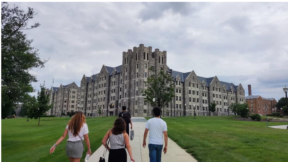
Abbildung 11: Dorms im Osten des Campus