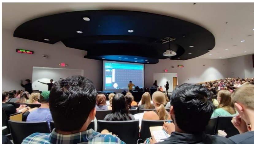
Abbildung 26: Vorlesung in der Colonial Hall im Squires Student Center

An dieser Stelle muss man jedoch anbringen, dass es ganz darauf ankommt, wie man seine „Balance“ zwischen Studium und Freizeit/Erlebnissen definiert. Ich persönlich habe recht hohe Ansprüche an mich selbst und habe das Semester entsprechend der ins Studium investierten Zeit mit guten Noten abgeschlossen. Wie oben erwähnt ist es jedoch auch möglich, die Kurse mit weniger Arbeitsaufwand und mittelmäßigen Noten zu bestehen.