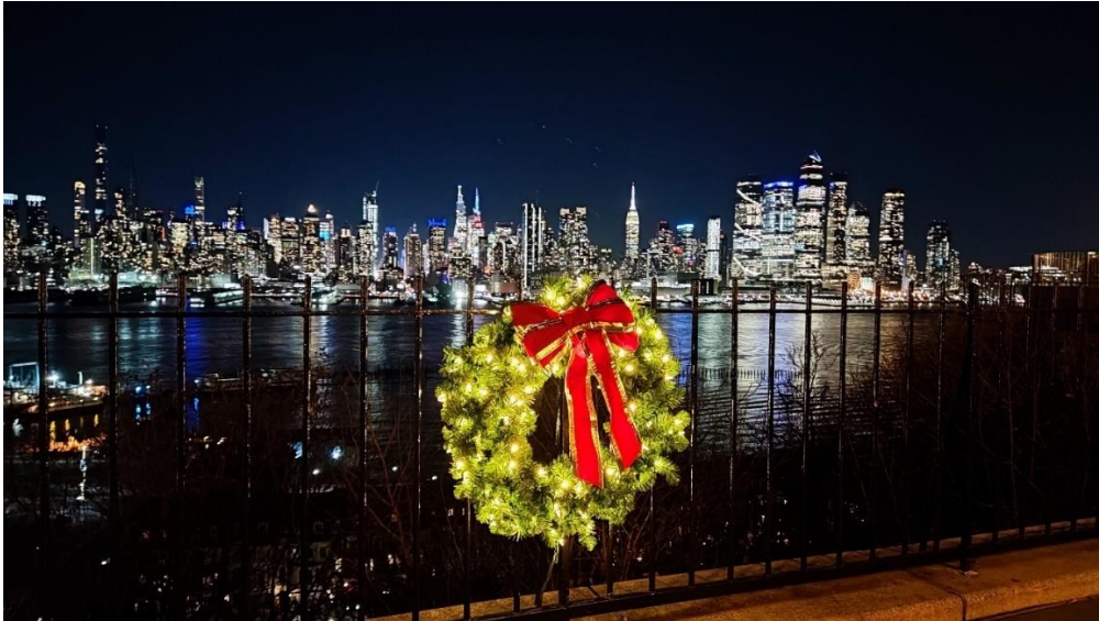
Abbildung 49: New York Skyline bei Nacht (von New Jersey aus)