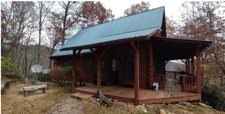
Abbildung 43: Unser Airbnb nahe Asheville (Cabin in the woods)