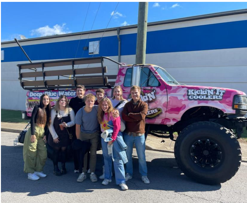
Abbildung 40: Gruppenfoto vorm Monstertruck