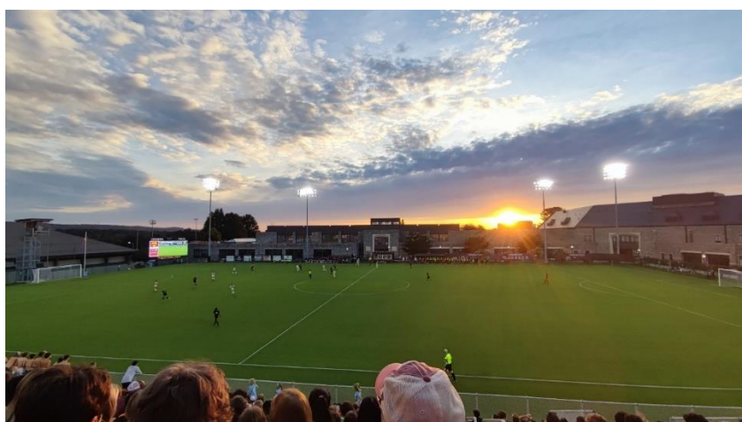
Abbildung 25: Soccer Game