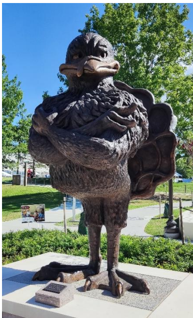
Abbildung 6: HokieBird Statue