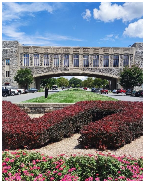
Abbildung 7: Torgersen Bridge