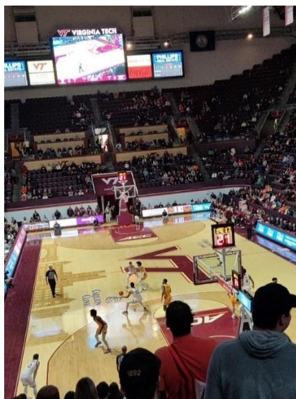
Abbildung 24: Basketball Spiel im Cassell Coliseum