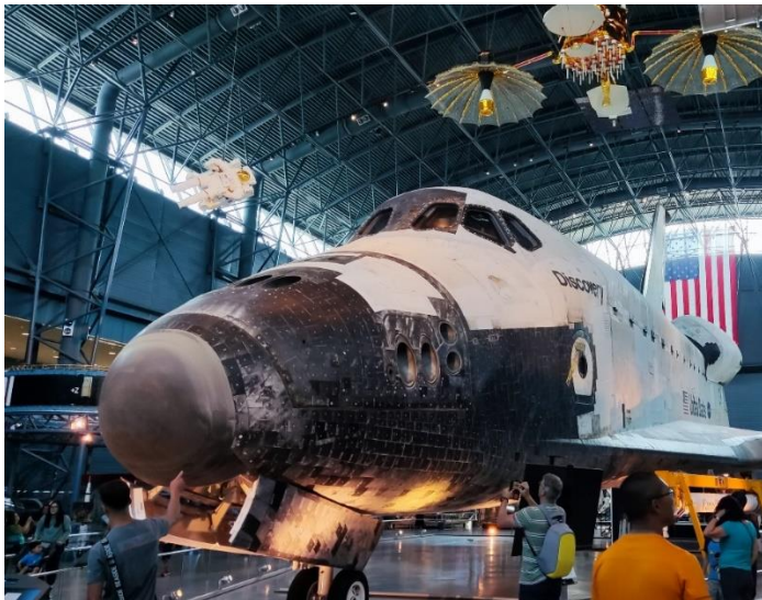
Abbildung 34: Space Shuttle im Steven F. Udvar-Hazy Center (National Air and Space Museum am Airport)