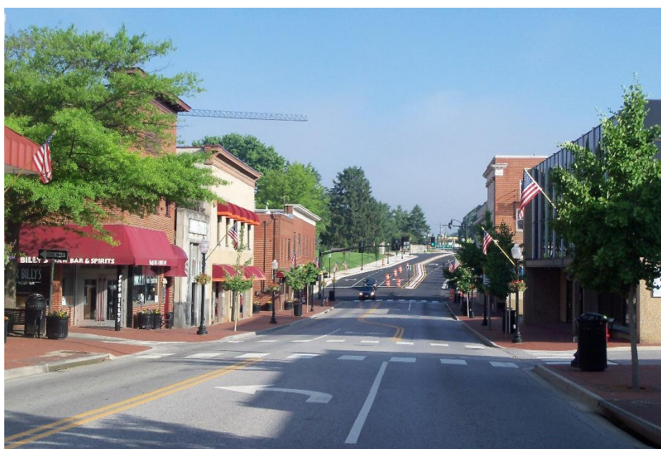
Abbildung 1: Downtown Blacksburg

Blacksburg ist (außerhalb des Campus) eine wirklich schöne, kleine Stadt mit vielen Restaurants und Cafés, die hin und wieder eine nette Abwechslung vom Campus Essen ermöglichen. Außerdem gibt es einige Bars und Clubs. Aufgrund der bereits beschriebenen Lage des Ortes ist man ohne Auto jedoch ziemlich aufgeschmissen. Die Busse, welche man als Studierender kostenlos nutzen kann, bringen einen lediglich in die Nachbarorte. Falls man an ein Auto heran kommt (z.B. über Freunde, einen Mietwagen oder das Global Education Office) bietet die Region wunderschöne Spots zum Hiken oder Campen.