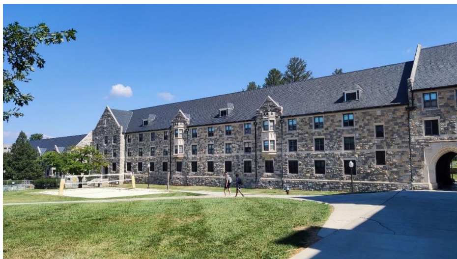
Abbildung 18: Whitehurst Hall

Gewohnt habe ich Dorm „Whitehurst Hall“. Dieses war ein only-boys Dorm und zudem eines der ruhigsten Dorms auf dem Campus. Während ich von anderen oft hörte, dass in bzw. vor deren Dorms nachts häufig Stimmen und Musik zu hören war, war es bei mir die ganze Zeit über ruhig. Interessant zu wissen ist, dass Freshmen (also Studierende im 1. Studienjahr) auf dem Campus in Dorms wohnen müssen, während der Großteil der älteren Studierenden off-campus, also im Ort Blacksburg, wohnt.