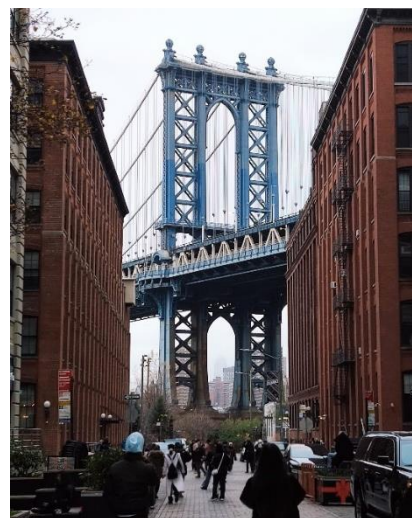
Abbildung 53: Bekannter Fotospot mit Blick auf die die Manhattan Bridge