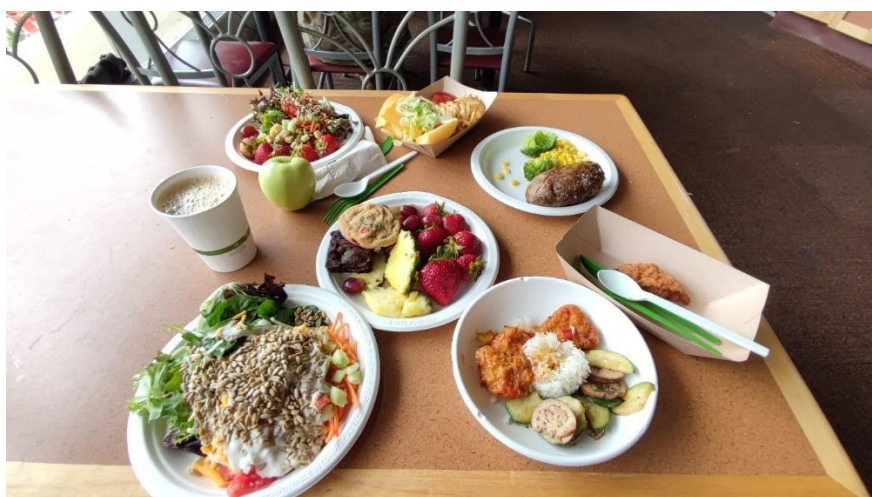
Abbildung 21: Typisches Mittagessen in D2

Von den vielen verschiedenen Essensmöglichkeiten auf dem Campus war ich wirklich begeistert. Insgesamt gibt es sechs Dining Halls, welche vergleichbar sind mit Food Courts: In jeder Dining Hall gibt es mehrere „Lokalitäten“, die alle verschiedenes Essen anbieten. So findet man auf dem Campus über Mexikanisch, Indisch, Asiatisch, Burger, Pasta, oder sogar Sushi so ziemlich alles. Ausgegeben werden, wie in Amerika üblich, meistens Bowls. Eine Ausnahme stellt hier die Dining Hall D2 dar, in der es ein großes Buffetessen mit mehreren Hauptpreisen, Salat, Obst und Dessert gibt. Trotz der großen Auswahl war es am Ende dann doch etwas eintönig, wenn man schon das dritte Mal innerhalb von ein paar Tagen in der gleichen Dining Hall saß. Zwar hat die VT schon oft den Award des bestem Campus Foods gewonnen, dennoch würde ich die Qualität des Essens im Vergleich zum europäischem Standard als „mittelmäßig“ bis „okay“ bezeichnen. Neben den Dining Halls gab es noch einige weitere Läden, wie zum Beispiel Dunkin' Donuts und Chick-fil-A. Besonders gern mochte ich persönlich Au Bon Pain (kurz abb): Dort gab es, ähnlich wie bei einem Bäcker, Heißgetränke und Gebäck.