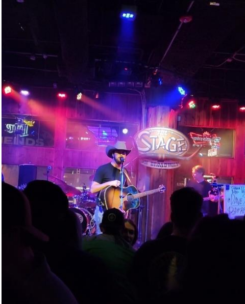
Abbildung 38: Live Musik in einer Country Bar

spannend. Das Highlight des Trips war eine Monstertruck-Tour durch die Stadt, bei der wir viel über die weit zurückgehende (Country-) Musikgeschichte der Stadt lernten, sowie ein Whiskey-Tasting erlebten. Die beiden Abende verbrachten wir in Country Bars im bekannten Downtown, wo sich unzählige Bars mit Live Musik sowie Cowboy Shops befinden. Geschlafen haben wir auch hier in einem Airbnb. Insgesamt fand ich die Stadt super cool und interessant, besonders durch den „Cowboy Vibe“.