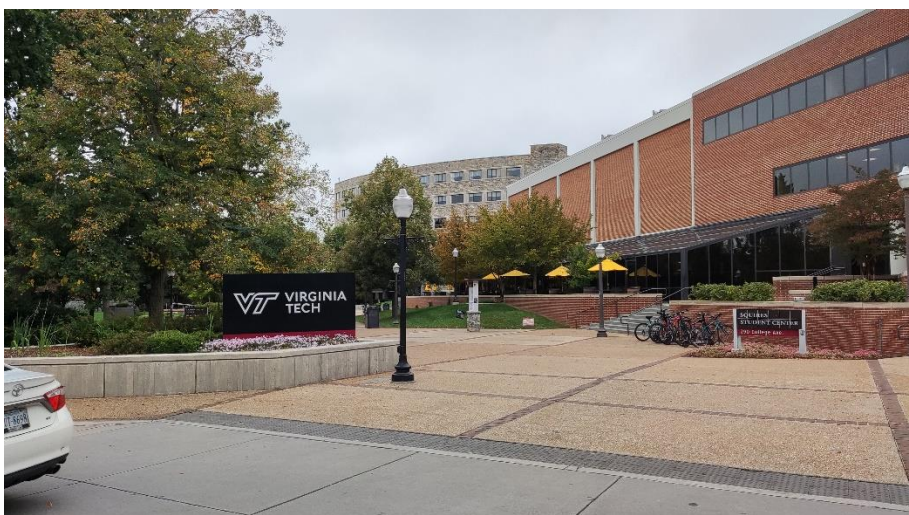
Abbildung 5: Campus Eingang von Downtown kommend