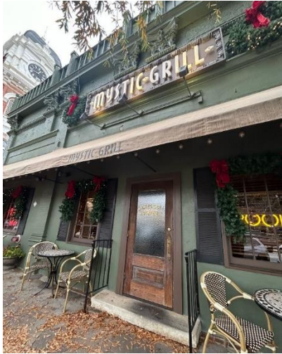
Abbildung 45: Restaurant "Mystic Grill", bekannt aus der Serie „Vampire Diaries“