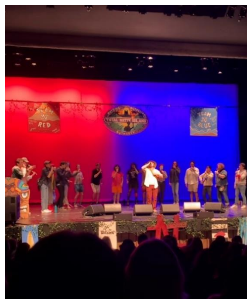
Abbildung 30: Fall Concert der A cappella Gruppe „Naturally Sharp“

An einem Wochenende waren wir mit den Leuten des International Office auf einem „Folk Festival“. Dieses fand statt auf einer Farm, wo man sehen konnte, wie traditionelle Farmen betrieben wurden. An einem anderen Wochenende waren wir dann auf einer Pumpkin Farm. Hier gab es Pig races (jap, ein Rennen unter Schweinebabys), Sonnenblumenfelder, und natürlich Kürbisse zu bestaunen.