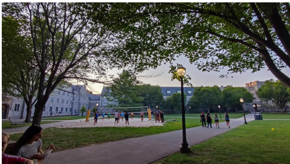
Abbildung 15: Volleyballfeld im Innenhof der Eggleston Dorms

Generell ist der Spirit auf dem Campus unvergleichbar zur Stimmung an der Uni hier in Deutschland. Man merkt, dass alle stolz darauf sind, an einem College und besonders an der VT studieren zu dürfen. Die Mehrheit der StudentInnen und ebenfalls viele Lehrende tragen Kleidung bzw. Merch der VT. Für mich persönlich war es ein tolles Gefühl, sich hier einzufügen, und so fand ich mich bereits nach wenigen Tagen voll eingekleidet bei Sportveranstaltungen „Go Hokies!“ rufend wieder. Wirklich hervor kam der beschriebene Stolz in mir selbst, nachdem wir (VT Kleidung tragend) in Nashville sowie in New York mit „Go Hokies“ angesprochen wurden. Das war für mich ein tolles Gefühl und zeigt die Bekanntheit der VT in der gesamten Region.