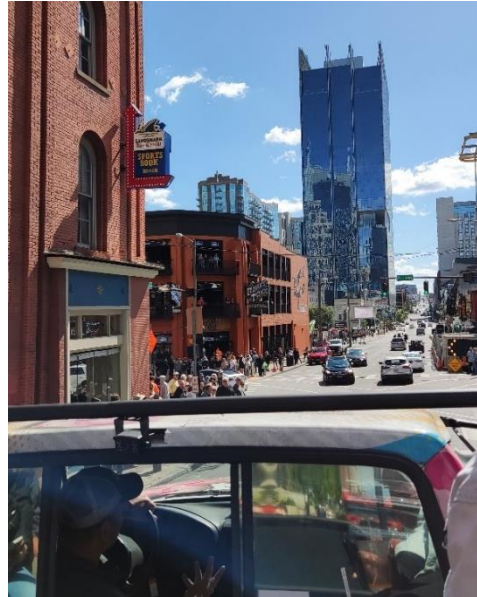
Abbildung 39: Downtown Nashville aus dem Monstertruck