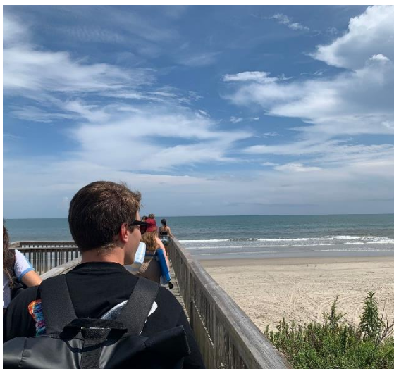
Abbildung 36: Am Strand in den Outer Banks