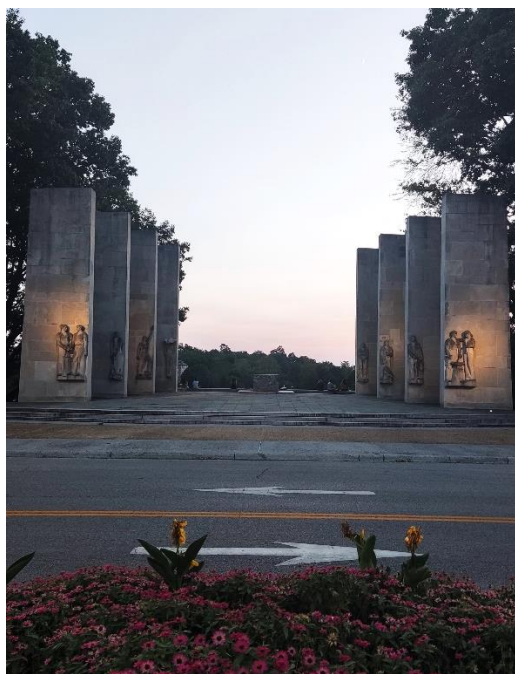
Abbildung 3: Arbeitsplätze in der Torgersen Bridge Abbildung 4: The Pylons (War Memorial)