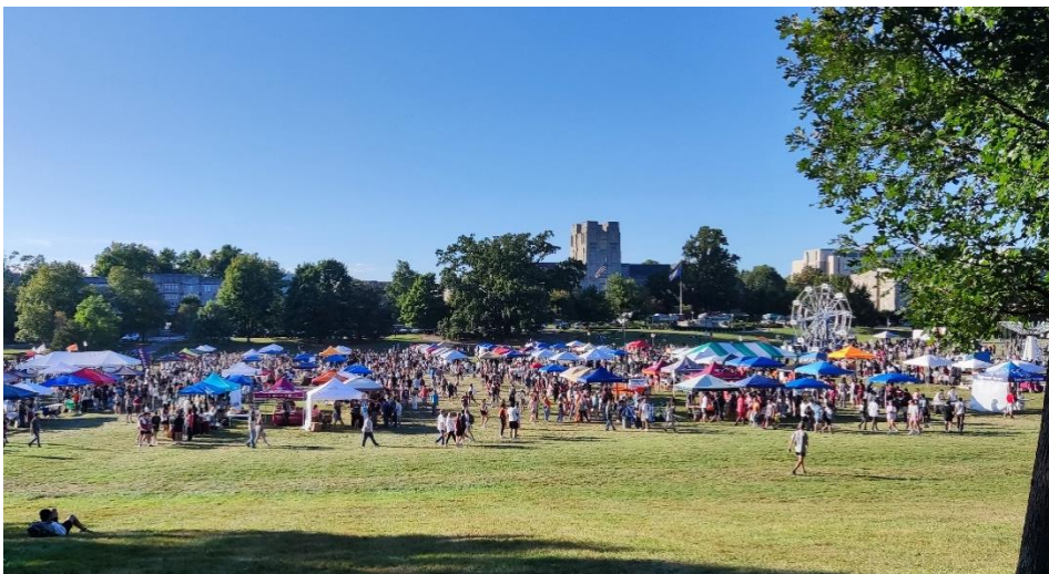
Abbildung 10: Gobblerfest auf dem Drillfield

Nach der vom GEO veranstalteten Orientierungswoche gab es unzählige Orientierungsevents, welche durch die VT organisiert wurden. Besonders in Erinnerung geblieben sind mir hiervon das Recfest, bei welchem Sportangebote vorgestellt wurden und auch selbst ausprobiert werden konnten, sowie das Gobblerfest. Hierbei handelt es sich um ein riesiges Fest auf dem Drillfield (ein großer Rasenplatz in der Mitte des Campus), bei dem alle Clubs der VT einen Stand bzw. ein Zelt haben und um neue Mitglieder werben. Hier war ich mehr als überwältigt von der Anzahl an Clubs und Organisationen, die die VT zu bieten hat (1041 mit Stand Januar 2024!!), sowie von der Vielfalt der Angebote (von Sport über Engineering, Kunst, Tanzen, Singen, Vögel beobachten, ...). Hier findet wirklich jeder etwas. Empfehlen kann ich an dieser Stelle die Website gobblerconnect.vt.edu , auf der alle Clubs zu finden sind, sowie die „Hokies on Track“ App, in welcher man alle Orientierungsevents findet.