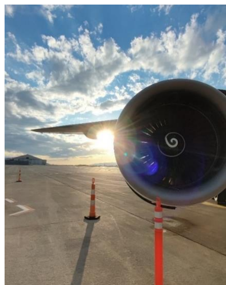
Abbildung 28: Triebwerk der B757

Darüber hinaus haben wir das Corporate Research Center besucht, welches sich in der Nähe des Campus befindet. Hier hatten wir ein Gespräch mit dem CEO des Research Centers sowie einer Mitarbeiterin. Dieses Gespräch hinterließ bei mir gemischte Gefühle: Zum einen war es durchaus interessant, mit dem CEO über die Unterschiede der Luftfahrtbranche in den USA und in Deutschland zu reden, da dieser ebenfalls Flugzeugbau studierte. Auf der anderen Seite zeigte sich hier etwas, dass