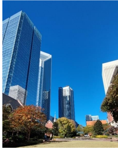
Abbildung 46: Hochhäuser in Charlotte