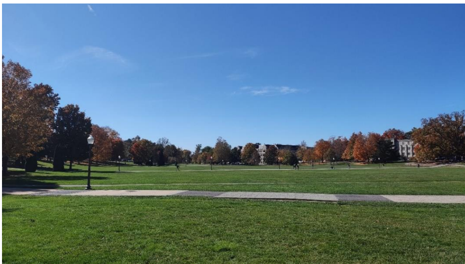
Abbildung 12: Drillfield