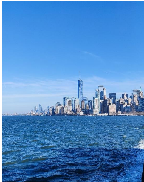
Abbildung 51: South Manhattan von der Staten Island Ferry aus