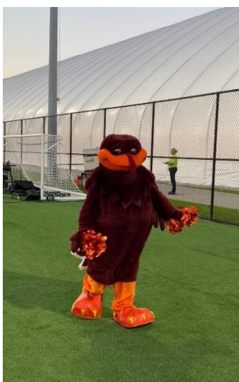
Abbildung 13: HokieBird (Maskottchen der VT)