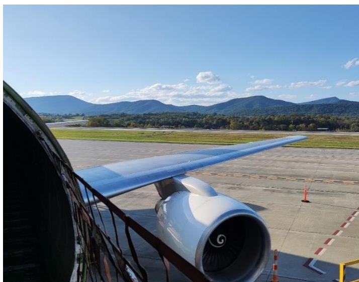
Abbildung 27: Blick aus dem Rumpf der B757 in Roanoke

Im Rahmen der Exkursion besichtigten wir mit Pat Artis eine Boeing 757 am Airport in Roanoke. Dies war für mich eines der besten Erlebnisse während des Semesters. Wir durften uns jedes Detail des Flugzeugs, von außen sowie von innen, genau anschauen und Fragen stellen. Zusätzlich hat uns ein überaus sympathischer Pilot mit ins Cockpit genommen und uns dieses genauestens erklärt.