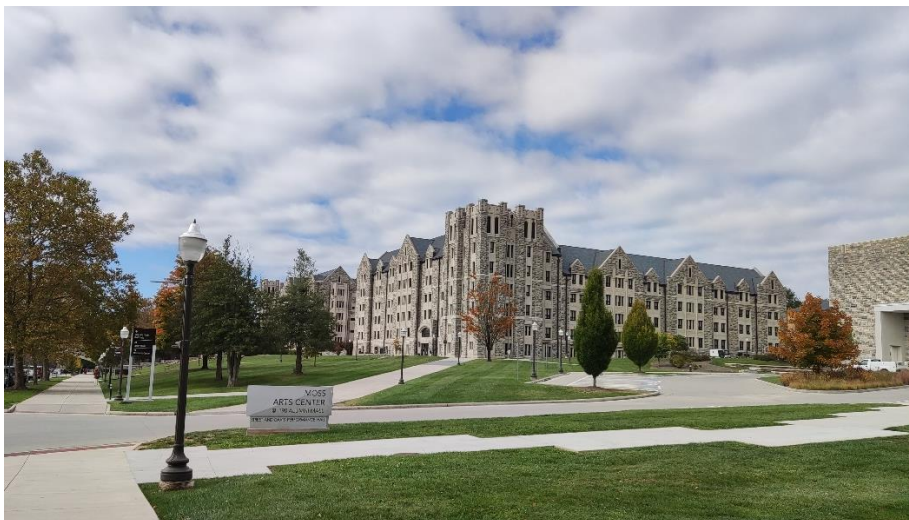
Abbildung 2: Pearson Hall East