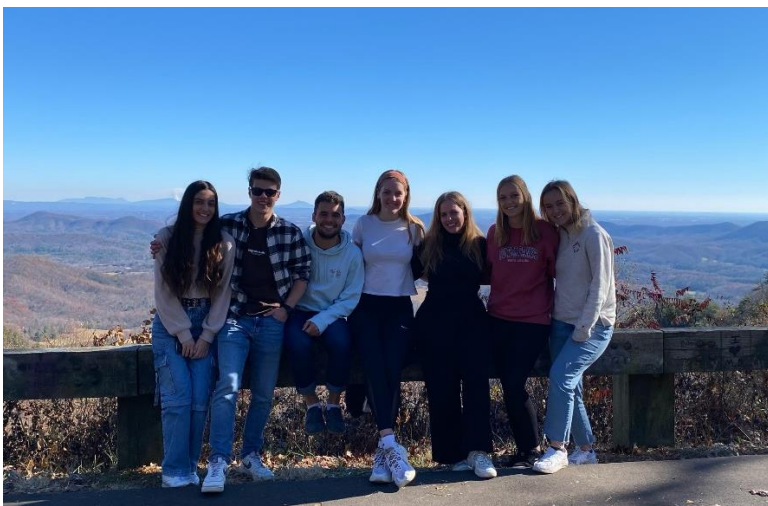
Abbildung 44: Gruppenfoto an einem Aussichtspunkt entlang Blue Ridge Mountain Trails