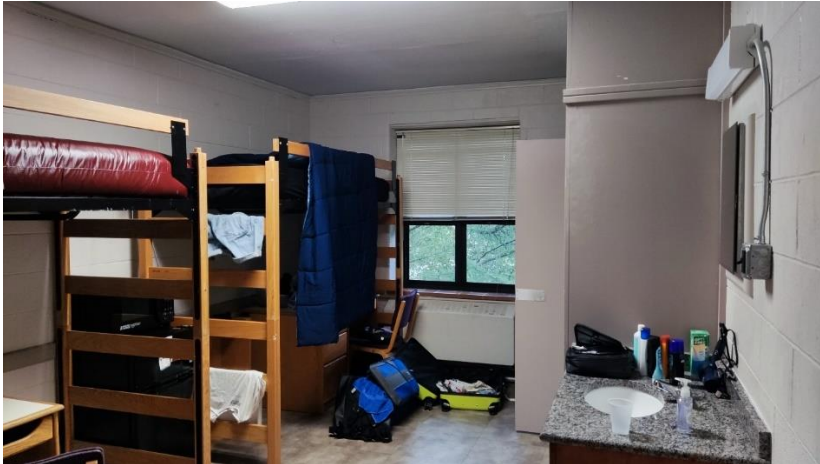
Abbildung 19: Mein Zimmer im Dorm Whitehurst Hall

Wie bereits oben erwähnt, muss sich jeder selber um Bettzeug sowie um weitere Einrichtungsgegenstände und auch Putzzeug kümmern. Jeder Flur verfügt über mehrere Waschräume, in denen sich die Toiletten und Duschen befinden.