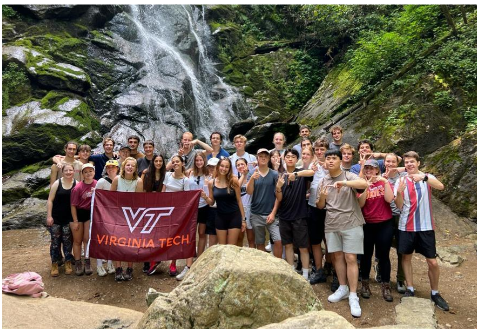
Abbildung 9: Gruppenfoto beim Hike in der Orientierungswoche