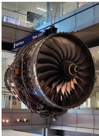
Abbildung 16: Rolls Royce Trent 1000, ausgestellt in der Goodwin Hall

jedes der fünf Stockwerke seine eigene Atmosphäre (von ganz still bis ziemlich unruhig) hatte. Sofern es zeitlich möglich war, ging ich zwischen den Vorlesungen ins Fitnessstudio. Abends trafen wir uns immer mit unserer Gruppe zum Essen und nahmen anschließend an Events teil, schauten einen Film oder suchten uns einen gemütlichen Ort zum Quatschen.