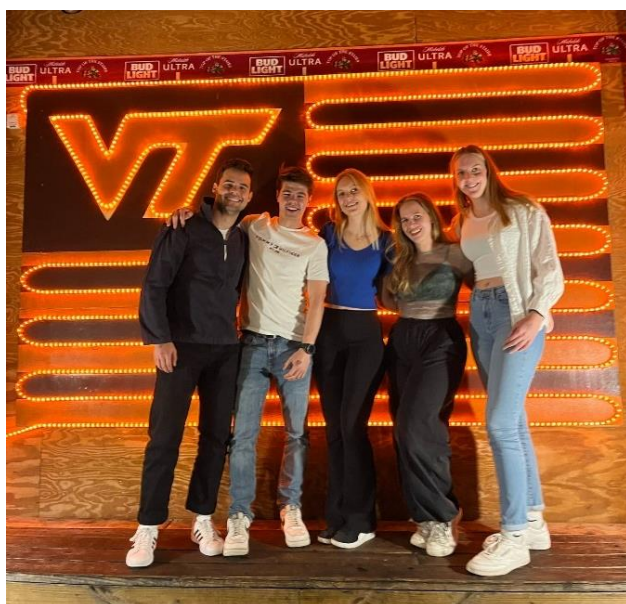
Abbildung 29: Gruppenfoto vor der bekannten VT Flagge in der Bar TOTS

Wie im Kapitel 4.2 Leben auf dem Campus beschrieben, verbrachte ich die meiste Zeit in der Bibliothek. Trotzdem boten sich einige Gelegenheiten für Freizeitaktivitäten: Beispielsweise waren wir einige Male im Kino, selbstverständlich auch in einigen Bars in der Main Street direkt am Campus sowie auf Housepartys. Generell muss angemerkt werden, dass es unter 21 kaum möglich ist, in Bars oder auf Partys zu gehen. Dies merkten wir sowohl bei abendlichen Veranstaltungen in der Nähe des Campus als auch auf unseren Trips. Unter 21 ist man, was Ausgehen betrifft, sehr eingeschränkt, da die Amerikaner hier echt streng sind. Alternativ verbrachten wir viele Abende mit Movie Nights in einer der Lounges in den Dorms. Darüber hinaus gingen wir zu vielen von der VT veranstalteten Events auf dem Campus, wie beispielsweise einer Silent Party, Bingo Nights, Konzerten der A cappella Gruppen oder an Weihnachten zum Verzieren von Lebkuchenhäusern. Am Wochenende war entweder lernen bzw. Hausaufgaben bearbeiten angesagt. Oft nutzten wir die Wochenenden jedoch zum Einkaufen, entspannen oder beispielsweise zum Volleyball und Frisbee spielen.