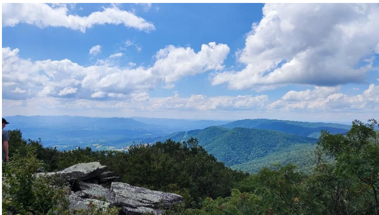
Abbildung 8: Aussicht vom Bald Knob