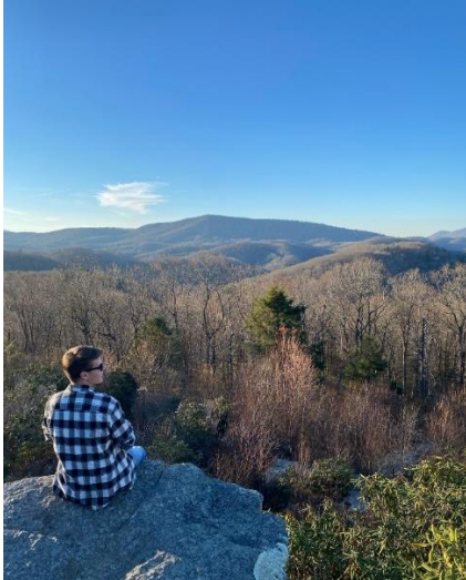
Abbildung 41: Aussichtspunkt entlang des Blue Ridge Mountain Trails

hatten wir ein super schönes „Cabin in the woods“, welches sich mitten im Wald befand. Hier waren wir wandern und besichtigten den Drehort der Serie „Vampire Diaries“. Weiter in Atlanta schauten wir uns neben der Stadt ein Icehockey Game an. Charlotte war für mich eine der schönsten Städte, die ich bisher in den USA gesehen habe. Hier kochten wir uns unser eigenes Thanksgiving Dinner und waren (zur Freude der Flugzeugbau-StudentInnen) planespotten am Airport.