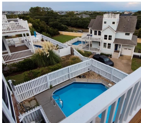
Abbildung 37: Aussicht vom Balkon unseres Beach-Hauses