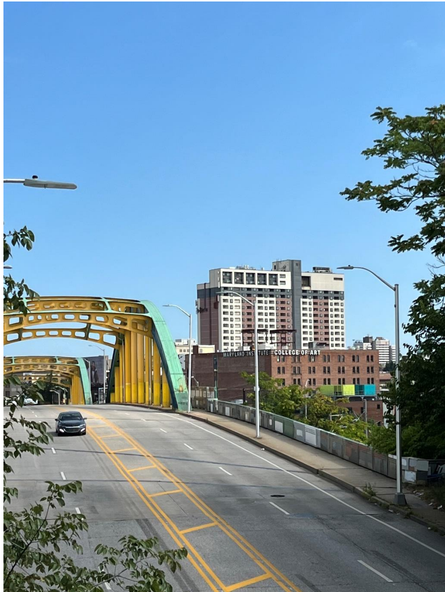
Abb.1: Campus: Maryland Institute College of Art