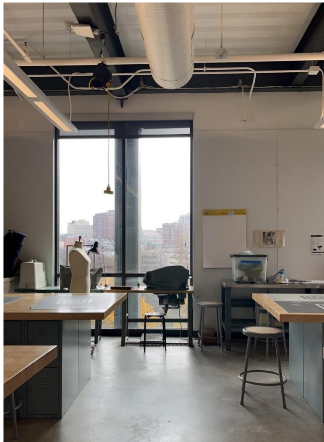
Abb.2: Product Design Studio, MICA

Ich habe während meines Auslandsaufenthalts vom vielfältigem Kursangebot der MICA sehr profitiert: Ich habe insgesamt vier Studio-Kurse und einen Theorie-Kurs belegt. Zwei der Studio-Kurse waren Designkurse: Design Fundamentals und Designing Information.