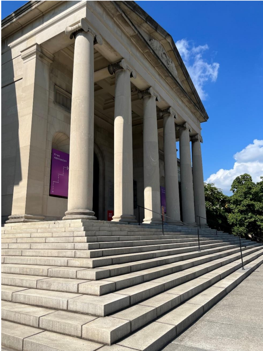
Abb.6: Baltimore Museum of Art

Hafen und die Einkaufsmöglichkeiten drumherum zu Fuß erreichen. Das Camden Yards - das Baseballstadium Baltimores - war ebenfalls in der Innenstadt und eine sehr beliebte Wochenends-Aktivität.