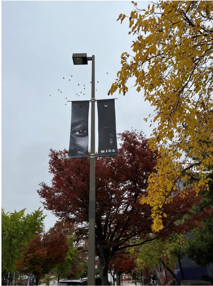
Abb.4: Fall 2022 MICA

Baltimore ist eine interessante Stadt: Es ist zwar eine Großstadt, jedoch eine kleine Großstadt. Sie liegt in der Nähe der Hauptstadt Washington D.C., weshalb es sehr gut möglich war über das Wochenende, auch innerhalb eines Tages, einen Kurztrip zu planen. Das Campus-Leben war sehr routiniert, ich habe zwar nicht am Campus gelebt, jedoch war ich nur 10min mit der Straßenbahn entfernt. An Tagen an denen ich zwei Studio-Kurse (á sechs Stunden) hatte, konnte ich auch nach Hause fahren. Es gab beliebte Spots zum Essengehen, wenn man nicht in die Mensa gegangen ist ( an dieser Stelle würde ich empfehlen keinen Mealplan zu kaufen , oder erst einen zu kaufen, wenn man das Essen vor Ort probiert hat). Um den Campus und am Campus gibt es viele gute Restaurants und Cafés und auch einige kleine Supermärkte, die man empfehlen kann. Eine weitere gute Sache waren die verschiedenen Möglichkeiten in der Freizeit am Campus zu arbeiten. So gut wie alle Studios und Ateliers waren unter der Woche und am Wochen-