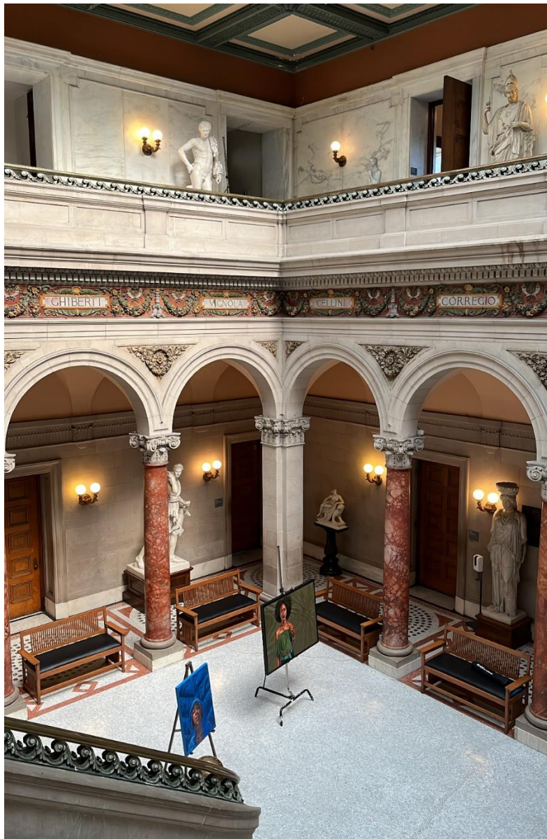
Abb.3: Main Building, MICA

verschiedenen Kontinenten begleitet mit Literatur und Sachbeispielen. Um auf einige besondere Techniken aufmerksam zu machen haben wir in der Vorlesung oft Dokumentationen über verschiedene Textilien und ihre Herkunft, Tradition, Geschlechterrolle bei der Herstellung und kulturellen Wert geschaut. In diesem Kurs ging es auch darum, wie man Textilien analysiert. Die Prüfung bestand aus einer Textilanalyse, wobei man sich aussuchen konnte, worüber man schreibt. Ein Schwerpunkt lag auch darin zu lernen wie man mit Literatur und Recherche umgeht, insbesondere für spezialisierte Themen.