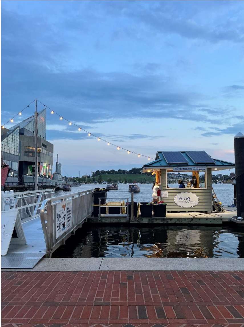
Abb.7: Der Hafen in Baltimore